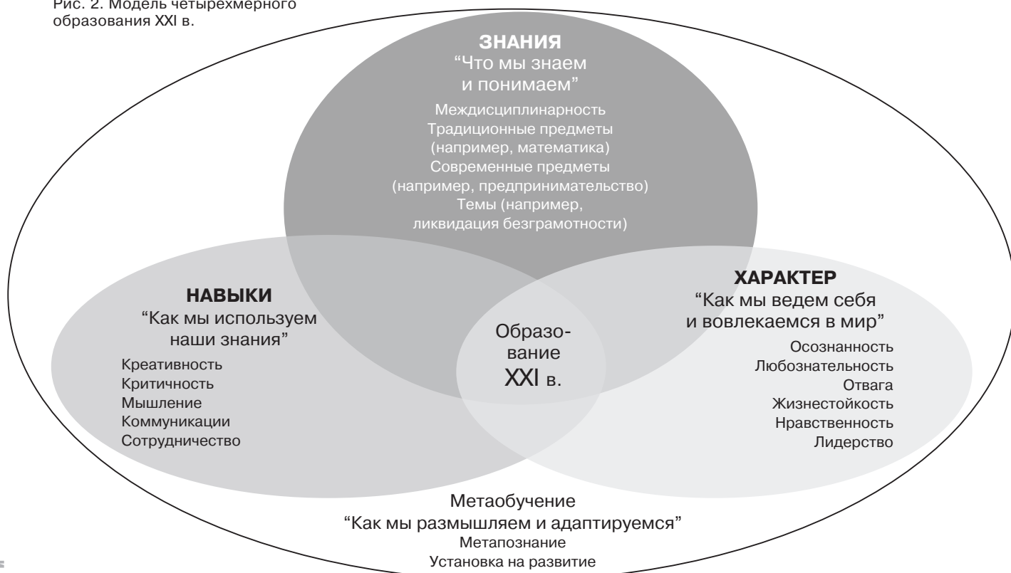
Рис. 2. Модель четырехмерного образования XXI в.

Отвечая на вызовы времени, ОЭСР в 2015 г. начала глобальный межстрановой проект “Образование-2030” [10, 11], задача которого — поддержать государства в переосмыслении реформы образования, определить приоритетные компетенции, которые будут иметь решающее значение и актуальность для учеников, чтобы создать будущее. Этот проект нацелен на формирование к 2020 г. общих для передовых стран принципов развития школы; общего понимания знаний, навыков, взглядов и ценностей, необходимых учащимся