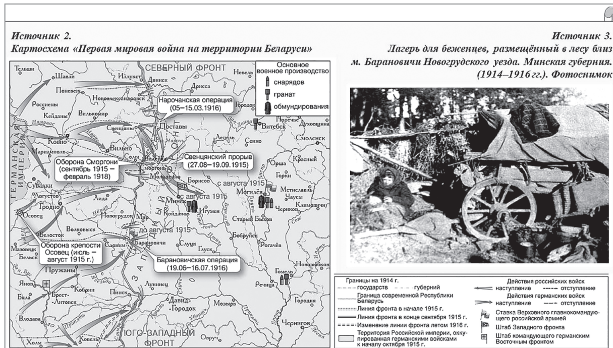
Рисунок 6 — Задание 5 демонстрационного варианта РКР по учебному предмету «История Беларуси в контексте всемирной истории» [3]